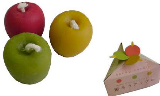
【蜜ろうアップルろうそく】

飯田市の養蜂家の蜜ろうを使用。市内福祉施設で製作し、売上のうち200円が寄付されます。