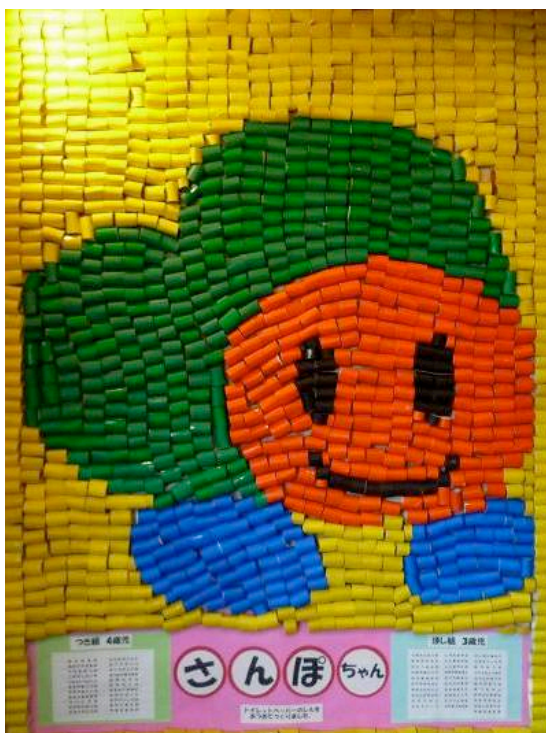
明星保育園の子ども達が、トイレトペーパーの芯で <さんぼちゃん>を作ってくれました！

本号では、2010年度の事業報告書を補足しながら、現場の報告などの最新情報をお知らせいたします。御一読くださいますようお願いいたします。