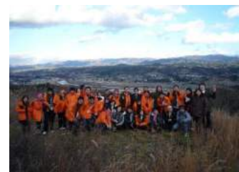
[ブルネイ大学・ブルネイ工科大学の皆様]