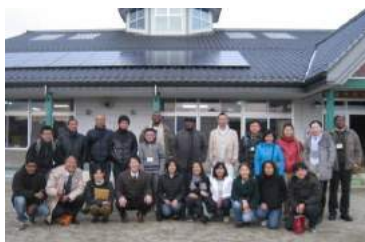
[東京農工大学の皆様]

昨年・今年度は、多くの方が弊社と飯田市の取組みを学ぶために視察にいらしてくださいました。平均しますと、週に2~3組の方にお越しいただいています。自然エネルギーが各地に広がっていくよう、多くの皆様との出会いやつながりを大切にしていきたいと思えます。