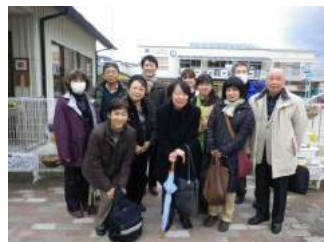
[奈良県「サークルおてんとさん」の皆様]