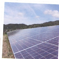
飯田山本おひさま広場には、野立パネルを設置しています!