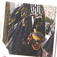
当地の獅子舞は、珍しい屋台獅子! 大きい!!

巨大獅子舞や大名行列など、さまざまな団体の演舞をお楽しみいただけます。おひさまスタッフがご案内!(参加団体の運行スケジュールは当日の状況によります)