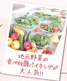
地元野菜の食べ放題バイキングが大人気!!